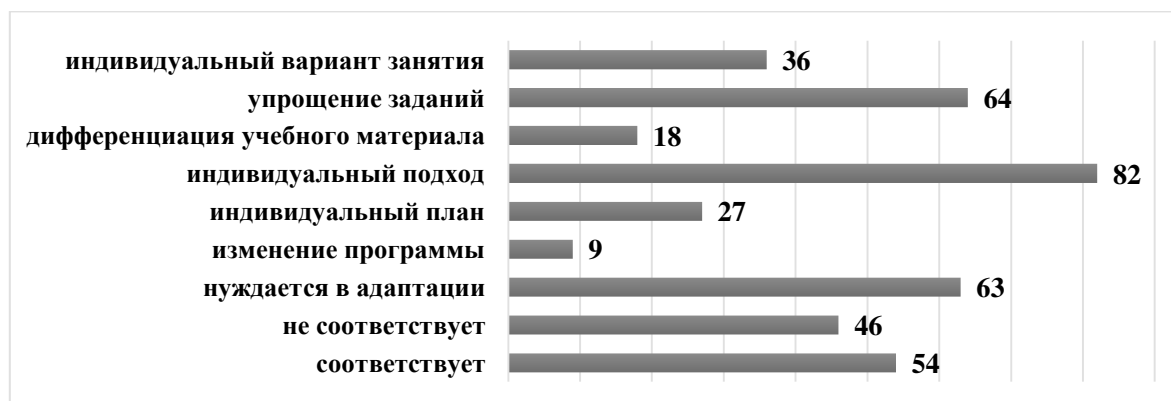
Рисунок 2 – Результаты ответов респондентов на исследовательский вопрос «Считают ли педагоги, что программа подходит реальным обучающимся или она нуждается в дополнительной адаптации?», %

Анализ ответов в рамках второго исследовательского вопроса показал следующее (Рисунок 2).