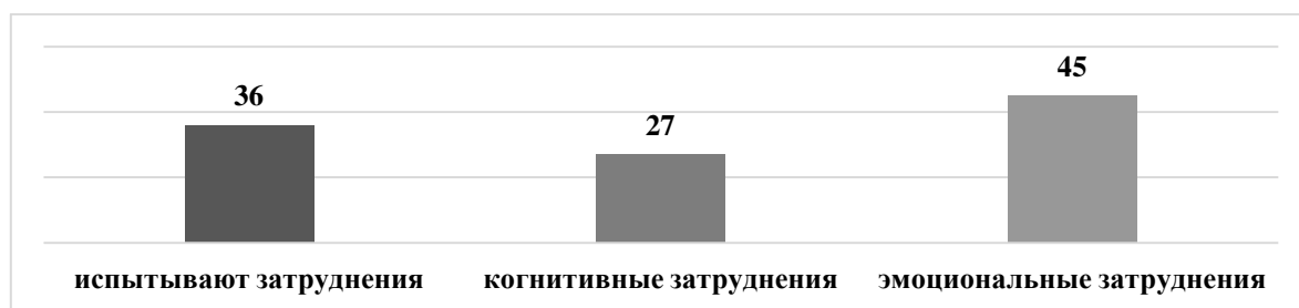
Рисунок 1 – Результаты ответов респондентов на исследовательский вопрос «С какими трудностями сталкиваются педагоги при реализации ДООП?», %

Было опрошено 11 педагогов, участвующих в реализации программы. Анализ ответов на вопрос о трудностях, с которыми сталкиваются педагоги, позволил выяснить следующее (Рисунок 1).